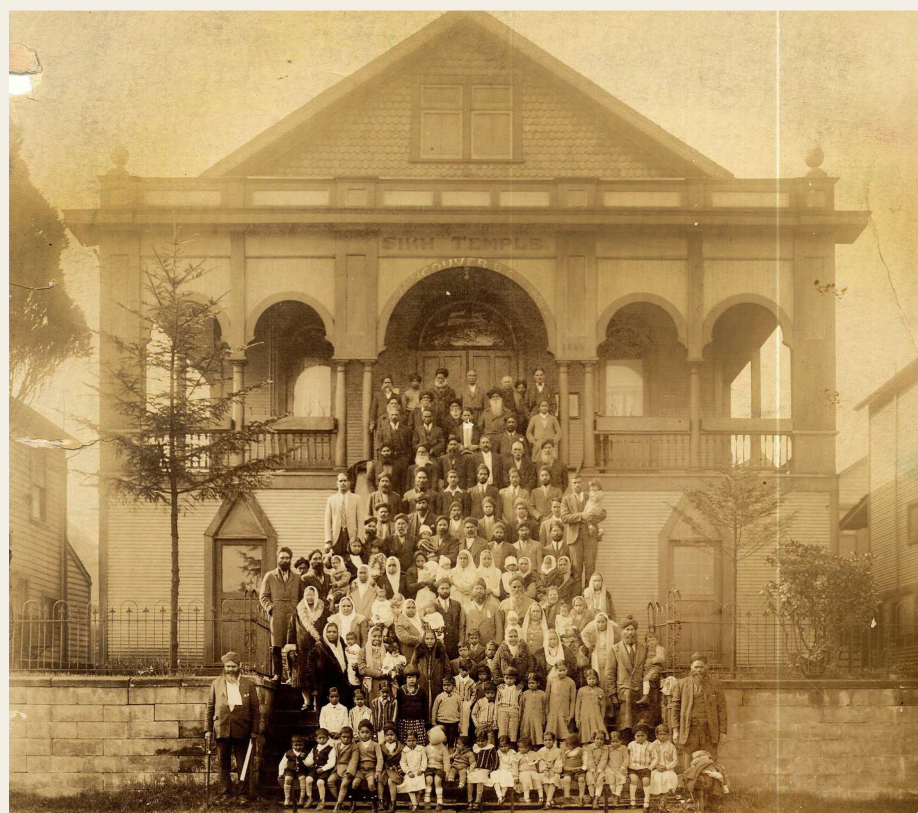
Sangat outside 2nd Avenue Gurdwara, Kitsilano, Vancouver

First Purpose Built Gurdwara in Canada - 1908