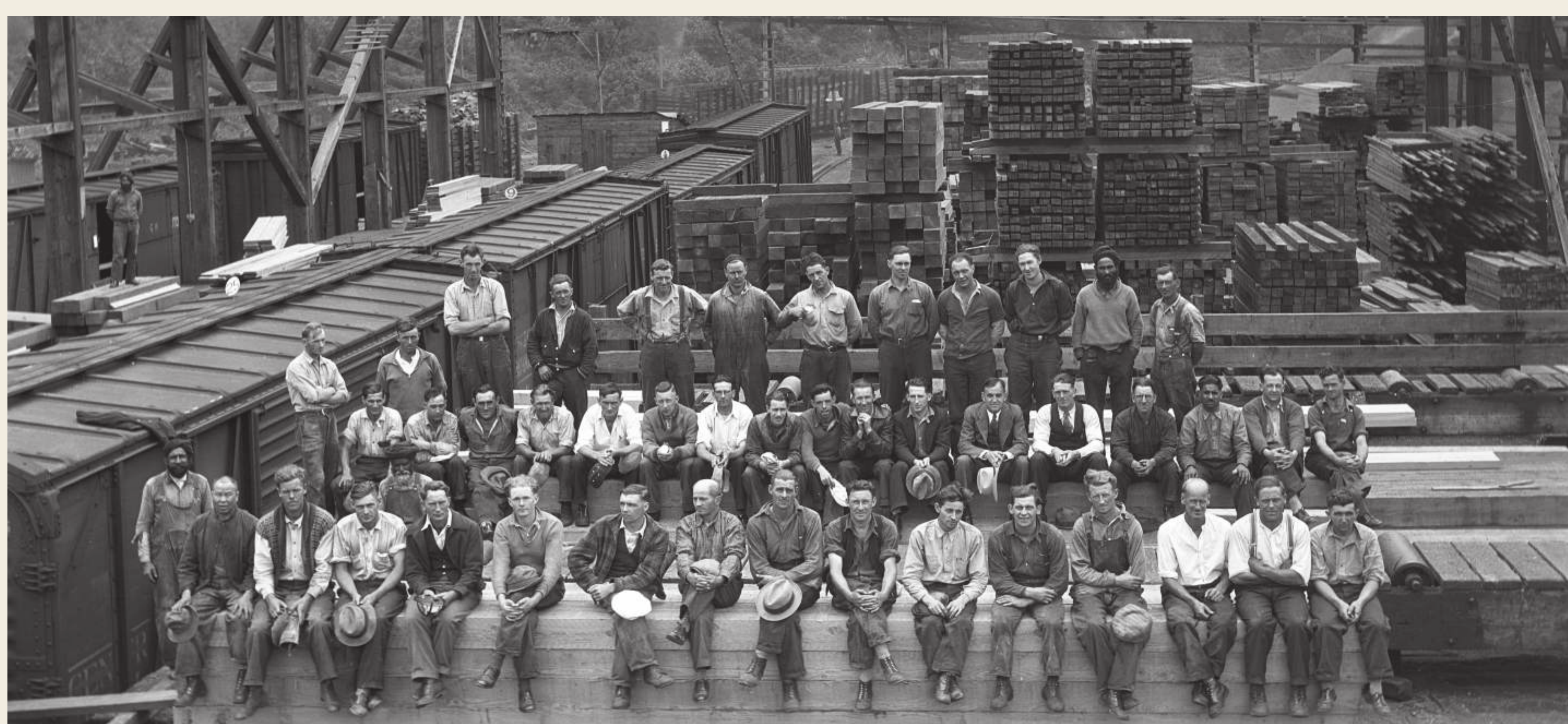
Group photo of lumber mill workers at Industrial Timber Mills Ltd, Youbou, B.C.